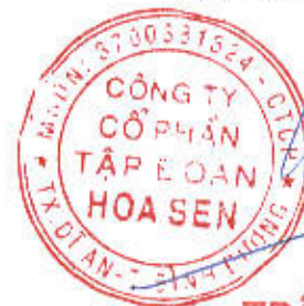
TRẦN NGỌC CHU

Ghi chú: Những chỉ tiêu không có số liệu có thể không phải trình bày nhưng không được đánh lại số thứ tự chỉ tiêu và "Mã số".