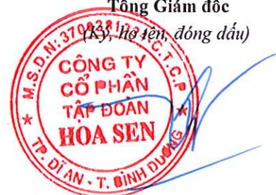
Trần Quốc Trí