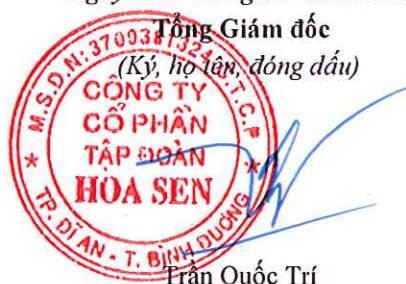
Trần Quốc Trí