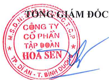
TRẦN QUỐC TRÍ